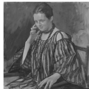
小磯良平《西洋婦人図》1972年頃 油彩 神戸市立小磯記念美術館蔵

会 期：2026年4月4日(土)～5月17日(日) 休 館 日：月曜日(ただし5月4日は開館)、5月7日(木) 開館時間：10:00～17:00(入館は16:30まで) 割 引：会員証の提示で団体料金に割引(会員と同伴者4名まで) 一般200円→160円、大学生100円→50円、高校生以下無料 ※大学生・高校生は、学生証や生徒手帳などを提示ください ※神戸市在住の65歳以上の方は無料(住所と年齢が証明できるものを提示ください)