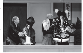
第2部 菅原伝授手習鑑

演目：<第1部>11時開演 菅原伝授手習鑑 車曳の段/桜丸切腹の段 他 <第2部>15時開演 菅原伝授手習鑑 寺入りの段/寺子屋の段 他 <第3部>17時30分開演 二人禿 ひらがな盛衰記 神崎揚屋の段 他