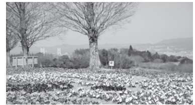
あわじ花さじき (イメージ)

【注意事項】 奇数人数のお申込みの場合、バスの座席は他のグループの方と相席となります。予めご了承ください。