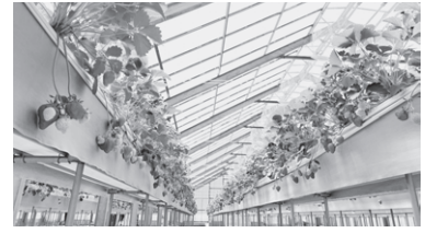
淡路カントリーガーデン いちご狩り (イメージ)