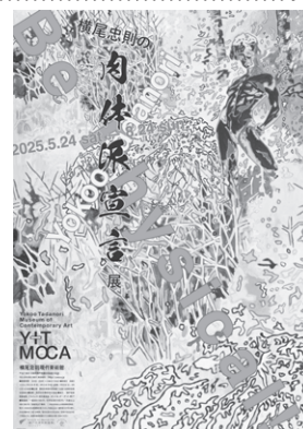
ポスター(デザイン: 横尾忠則)