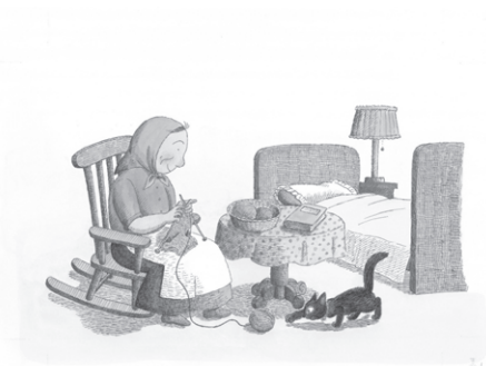
絵本『いそがしいよる』福音館書店(1981年)より 絵本原画 小さな絵本美術館蔵