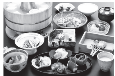
昼食 (イメージ) (ゆ豆腐鍋は4人用となります)

ツアー中のマスクの着用はお客様個人のご判断に委ねることになりますが、皆様が気持ちよくご旅行をお楽しみいただけるよう、咳エチケット、継続的な会話などの際はマスクの着用など、周囲へのご配慮をお願いいたします。バス車内の換気を行い、アルコール消毒液の設置をいたします。