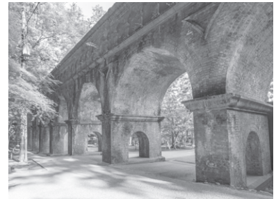
南禅寺 水路閣 (イメージ)

旅行企画実施旅行社 神姫観光株式会社 ☎078-939-2090 観光庁長官登録旅行業2108号(一社)日本旅行業協会正会員 神戸市西区竹の台1-407-2 総合旅行業務取扱管理者: 大内 隆司 担当: 藤村 運行バス会社 神姫観光バス