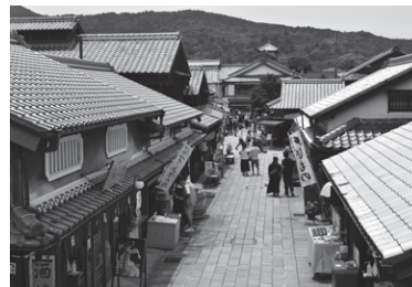
おかげ横丁街並み（イメージ）

旅行企画実施旅行社 株阪急交通社 神戸センター ☎078-331-3589 観光庁長官登録旅行業第1847号 日本旅行業協会正会員 神戸市中央区加納町4-2-1 EKIZO神戸三宮2F 総合旅行業務取扱管理者：山本 清彦 担当：山本 運行バス会社 東豊観光