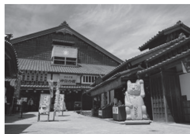
おかげ横丁街並み（イメージ）

ツアー中のマスクの着用はお客様個人のご判断に委ねることになりますが、皆様が気持ちよくご旅行をお楽しみいただけるよう、咳エチケット、継続的な会話などの際はマスクの着用など、周囲へのご配慮をお願いいたします。バス車内の換気を行い、アルコール消毒液の設置をいたします。