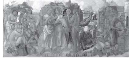
小磯良平「働く人びと」 1953年 油彩・キャンバス 神戸市立小磯記念美術館寄託

会 期：2023年10月7日(土)～12月17日(日) 休 館 日：月曜日 (ただし、10月9日は開館)、10月10日 開館時間：10:00～17:00 (入館は16:30まで) 割 引：会員証の提示で団体料金に割引 (会員と同伴者4名まで) 一般1,000円→800円、大学生500円→250円、 高校生以下無料 (要証明) ※神戸市内在住の65歳以上の方：500円 (要証明) 問合せ先：078-857-5880