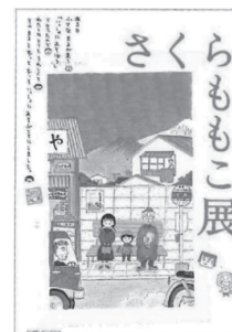
さくらももこ展 キービジュアル ©さくらももこ ©さくらプロダクション