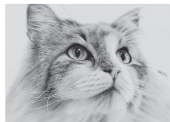
音海はる《透き通る》2020年