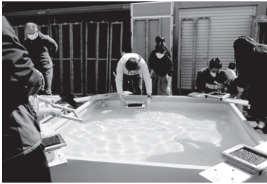
①木枠の型に海苔簾をセットし、のりの原料を流し入れて均等な厚さになるように海水にさらして漉します。

兵庫県の瀬戸内海側は、栄養が豊富で質の高いのりが育つことから全国有数の海苔の産地となっています。 去年12月から2月末までの累計販売数が、兵庫県が日本一となりました。 3月5日(日)多数の応募の中から抽選で50名の方に乾のりづくり体験にご参加いただきました。 お天気も晴天に恵まれ、体験スタート！