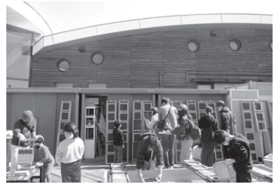
③そして、立てかけた枠にはめて乾燥させます。

お天気もよかったので20分くらい乾燥させたら持ち帰ることができました。おうちに帰ってから更に乾かし、軽くあぶれば、強い香りがある美味しいのりの出来上がりです。木枠の型に、均等な厚さになるように漉く工程が難しかったのですが、1枚目より2枚目、2枚目より3枚目。枚数が増えるごとに上手にできるようになりました。