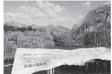
鈴鹿の森庭園 しだれ梅 (イメージ)

旅行代金 会員とその家族 おひとり 12,000円 非会員 おひとり 13,800円