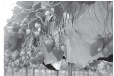
こうちく男爵いちご園 (イメージ)