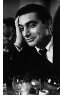
ロバート・キャパ・ポートレート(1951年)