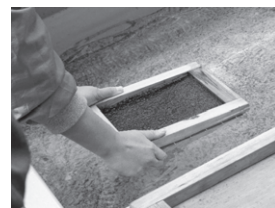
均等な厚さにするのは結構難しい…！