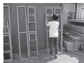
枠にはめて天日干し！乾燥すればのりの出来上がり♪