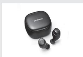
ノーブルオーディオフルワイヤレスイヤホン