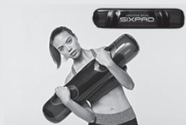
SIXPAD Water Weight