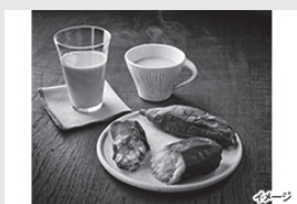
茨城県産冷やし焼き芋セット