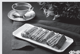
憧れホテルのグルメギフト