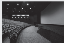
映画館 鑑賞チケット