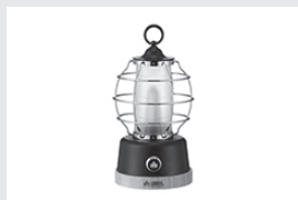
LOGOS Bambooキャビンランタン