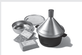
アペルカ テーブルトップスモーカー