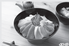
選べるカタログギフト