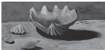
三岸好太郎《のんびり貝》1934 油彩・キャンパス 北海道立三岸好太郎美術館蔵