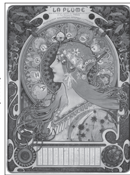
《黄道十二宮 ラ・プリウム誌のカレンダー》 OZAWAコレクション蔵