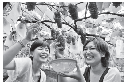
ぶどう狩りイメージ

旅行企画実施旅行社 (株)三洋航空サービス ☎078-411-8700 観光庁長官登録旅行業第1858号 全国旅行業協会正会員 神戸市東灘区岡本1-7-8 阪急岡本駅南1F 総合旅行業務取扱管理者：中塚 裕博 担当：丸山 運行バス会社 日本交通