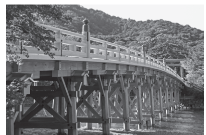
伊勢神宮イメージ

※コース内容および観光箇所が変更になる場合がございます。 また新型コロナウイルス感染予防対策等により、催行中止となる場合がございます。 ※最少催行人員に満たない場合には、旅行の実施を中止する場合がございます。この場合出発日の10日前までにご連絡致します。 ※取消料は通常料金(非会員料金)が基準となります。